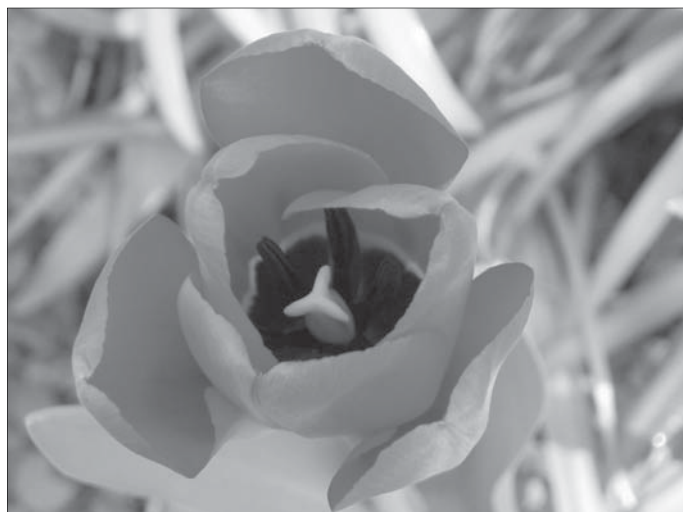
Zweifel, Einsicht, Liebe lockern die Welt auf, so dass Blumen wachsen können.

Stutzig aber macht mich die Bitte um heilsame Einsicht. Einsicht – das tönt so, als ob ich dann manches, das ich bisher für richtig und normal ansah, anders betrachten müsste. «Siehst du nicht ein, dass...», fragt man vorwurfsvoll jemanden, der stur auf seiner Meinung beharrt. Einsicht haben, das hiesse dann: eine eigene Position aufgeben, Zweifel zulassen, sich nicht verteidigen, sondern loslassen, einen Schritt zurücktreten, alles nochmals mit andern Augen neu ansehen. Nicht mehr um alles in der Welt recht haben müssen; sich selber – in seinem Rechthaben – nicht mehr so wichtig nehmen. Denn dort, wo wir bloss recht haben, «werden niemals Blumen wachsen», schreibt der israelische Dichter Jehuda Amichai (1924–2000):